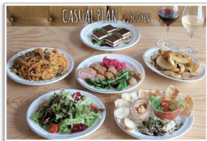
リーズナブルなのにこのボリューム感。 HATONOMORI 定番メニューが満載。