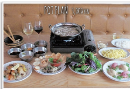
「たっぷり野菜と塩豚鍋」をご用意。 鍋を囲んで仲間たちとの話も弾みます♪