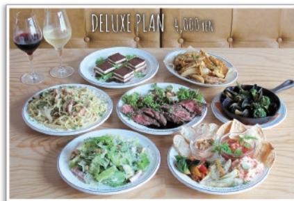
とにかく料理にこだわりたいグループにおすすめ！ シェフこだわりのメニューをご堪能いただけます。